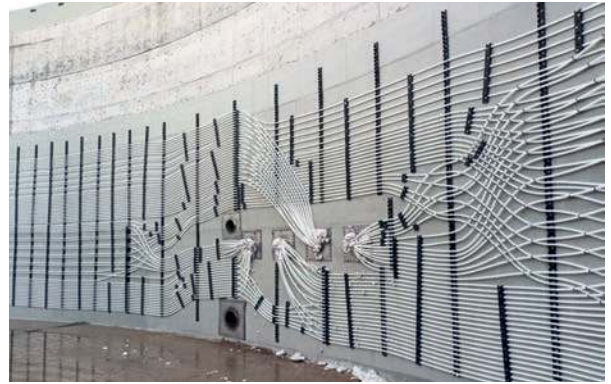
Doppelter Heizkreislauf, noch leer, daher sind die Schläuche noch weiß. Hier in weiß, da noch keine Befüllung stattgefunden hat.